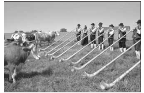
Alphorn-Bläserinnen und -bläser aus Walkertshofen (Landkreis Augsburg)