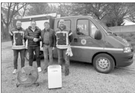
Spende Allianz Pfünder

Die Freiwillige Feuerwehr Waldkirch und die Gemeinde Winterbach bedanken sich recht herzlich bei der Versicherungsagentur Allianz Pfünder aus Gundremmingen für die Spende von 5 Luftentfeuchtungsgeräten und zugehörigen Ventilatoren. Außerdem durften sich die Vereinsmitglieder über eine Geldspende zur Anschaffung von Feuerwehrbekleidung für das 150-jährige Gründungsjubiläum der Feuerwehr freuen.