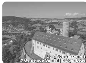
Burg Schwarzenfels

Das Schloss, dessen Ursprünge bis ins 16. Jahrhundert zurückreichen, wurde im Stil der Neorenaissance umfassend renoviert und erweitert. Parkstraße 2, Schlüchtern