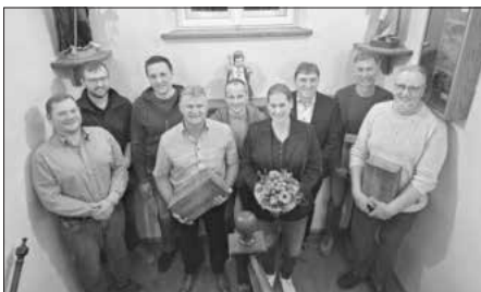
Verabschiedung alte Gemeinderäte