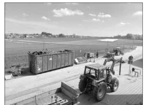
„Die Jugendfeuerwehr bedankt sich bei den Helfer:innen mit ihren Fahrzeugen.“