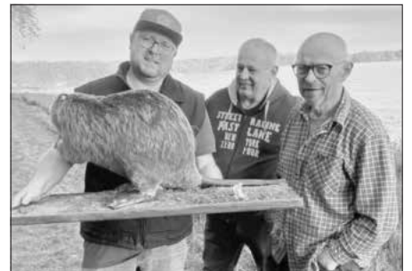
Das Team der Dorffreunde freute sich über einen gelungenen Waldtag.