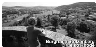
Burgruine Stolzenberg