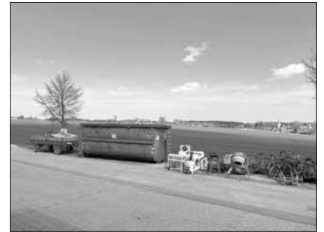
„Eine beachtliche Menge Schrott konnte gesammelt werden.“

werden. Die Jugendfeuerwehr bedankt sich bei allen Spender:innen, den freiwilligen Helfer:innen der Aktion, sowie den Leiter:innen unserer Jugendfeuerwehr für die Organisation und Verpflegung. Gott zur Ehr – dem Nächsten zur Wehr!