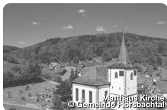
Mattheus Kirche

Das Heilbad am Spessart - ist bekannt für seine außergewöhnlich starken Solequellen, die u.a. in die Becken der Spessart Therme fließen. Die Stadt bietet spannende wie entspannende Möglichkeiten für Gesundheitsurlauber, Familienausflüge und Genusswanderer. TreffpunktDeutschland.de/bad-soden-salmuenster