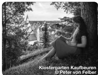
Klostergarten Kaufbeuren

Wie ein Schatzkästchen liegt er im Herzen des Allgäus, im bayerischen Süden Deutschlands. Er ist einer von neun Erlebnisräumen der Region und erstreckt sich über den gesamten Landkreis Ostallgäu, von Füssen über Pfronten, Nesselwang, Halblech, Marktoberdorf bis nach Kaufbeuren und Buchloe. Die königliche Gipfelkulisse aus Ammergau, Allgäuer und Tannheimer Bergen wachen wie steinerne Riesen über mystische Seen, rauschende Flüsse, sanft gewellte Hügelmeere und sattgrüne Wiesen, zwischen die Dörfer und historischen Städte eingebettet sind. Die archaische Poesie der Landschaft wirkt wie ein großer, weiter Park, der sich vor den vielen Schlössern und Burgen der Region ausbreitet, vor allem zu Füßen des Märchenschlosses Neuschwanstein. TreffpunktDeutschland.de/ostallgaeu