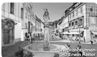
Neptunbrunnen © Erwin Reiter