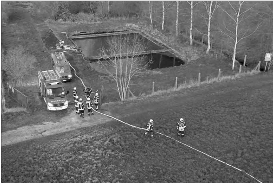
„Löschwasserentnahme aus dem Hafenhofener Behälter.“