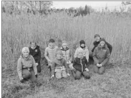
Die Aktivgruppe setzt sich für den Schutz der Kreuzotter im Naturpark ein.

Interessenten für die Junior-Ranger-Gruppe können sich gerne unter jr@naturpark-augsburg.de melden. Bei Fragen zum Gebiet oder zur Kreuzotter ist Gebietsbetreuerin Eva Liebig unter e.liebig@naturpark-augsburg.de zu erreichen.