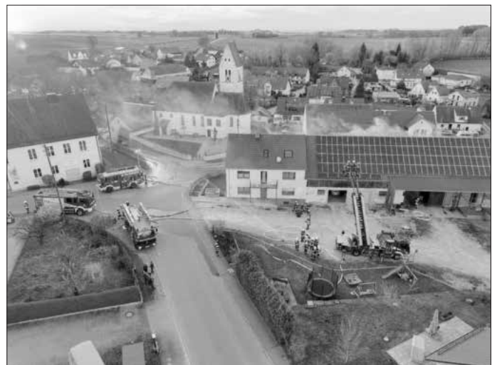
„Der Löscheinsatz ist im vollen Gange.“