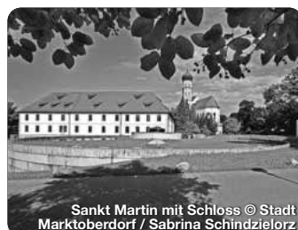
Sankt Martin mit Schloss