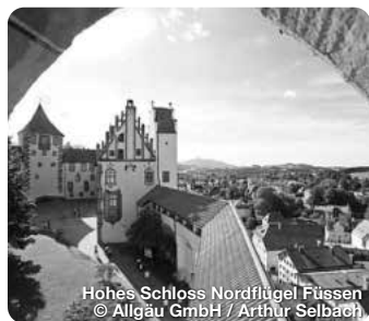
Hohes Schloss Nordflügel Füssen