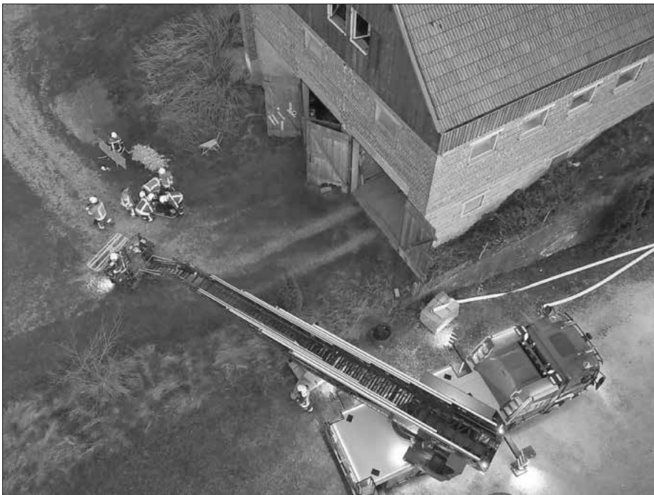
„Eine Person wurde über die Drehleiter gerettet.“