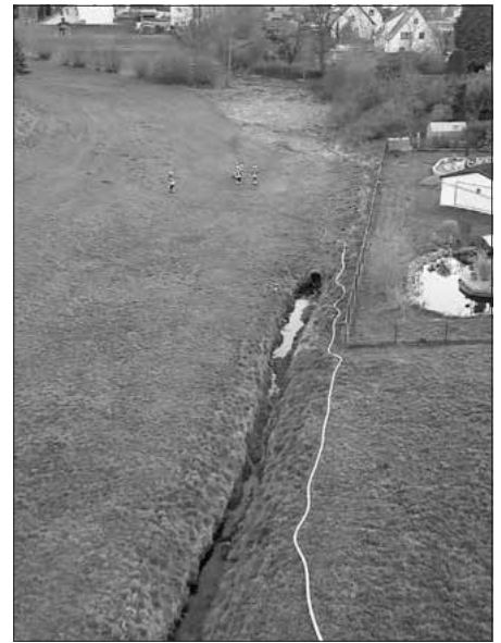
„Die Löschwasserleitung erstreckt sich in Richtung Einsatzstelle.“