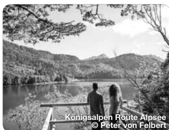
Königsalpen Route Alpeee