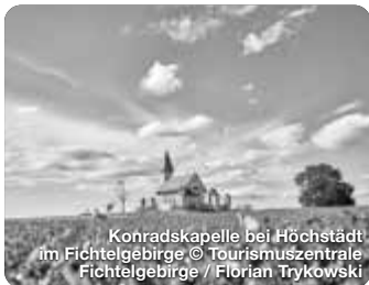
Konradskapelle bei Höchstädt im Fichtelgebirge

TreffpunktDeutschland.de/wunsiedel-region