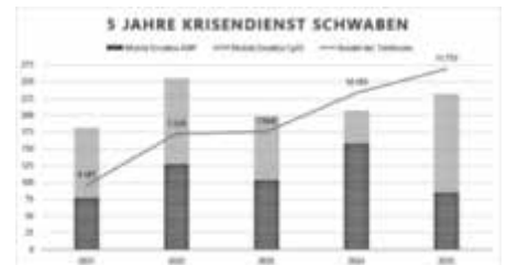
Die Entwicklung des Krisendienst Schwabens seit der Gründung 2021.

Hilfesuchende erreichen den Krisendienst kostenlos täglich von 0-24 Uhr unter der Telefonnummer 0800 / 655 3000 mit Dolmetscherdienst in 120 Sprachen.