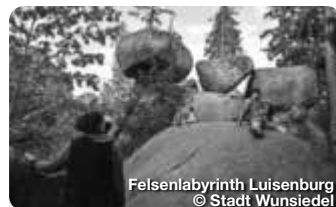
Felsenlabyrinth Luisenburg