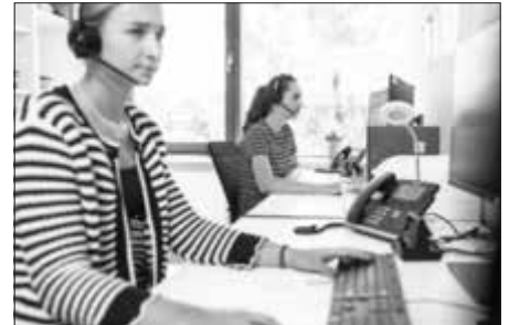
Soforthilfe in belastenden Situationen: Der Krisendienst ist rund um die Uhr für Sie da.