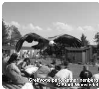
Greifvogelpark Katharinenberg