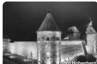
Burg Hohenberg