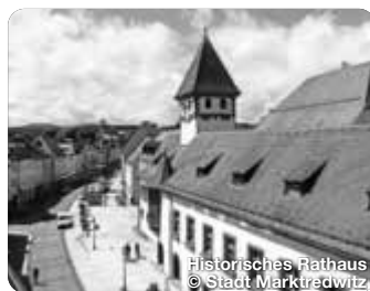
Historisches Rathaus