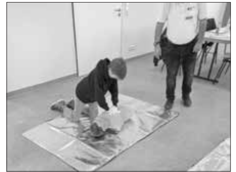
Ein Teilnehmer beim Üben der Herzdruckmassage