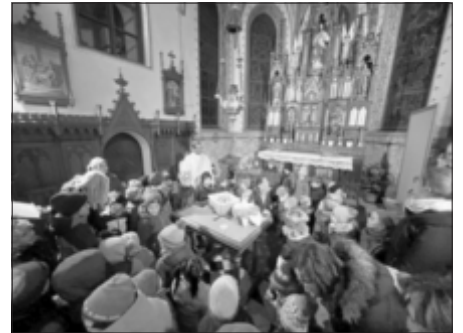
Der Elternbeirat und das Kindergarten-Team