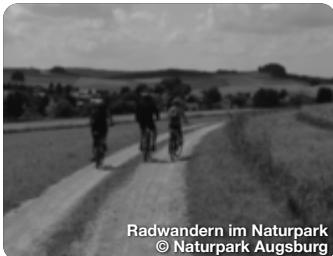
Radwandern im Naturpark

TreffpunktDeutschland.de/augsburger-land