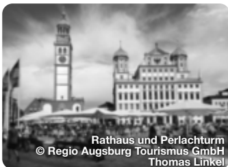
Rathaus und Perlachturm