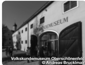
Volkskundemuseum Oberschönenfeld