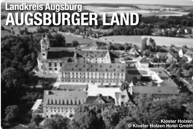
Kloster Holzen

Alle Termine und Angaben unter Vorbehalt!