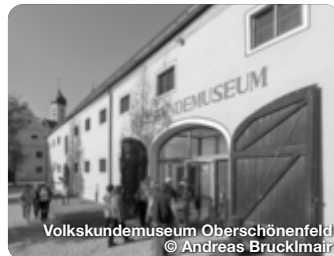
Volkskundemuseum Oberschönenfeld © Andreas Brucklmair