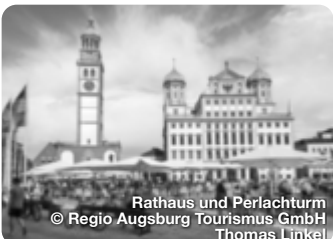
Rathaus und Perlachturm