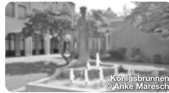
Königsbrunn © Anke Maresch