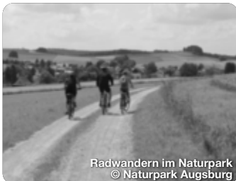
Radwandern im Naturpark

TreffpunktDeutschland.de/augsburger-land