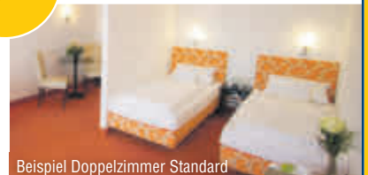
Beispiel Doppelzimmer Standard